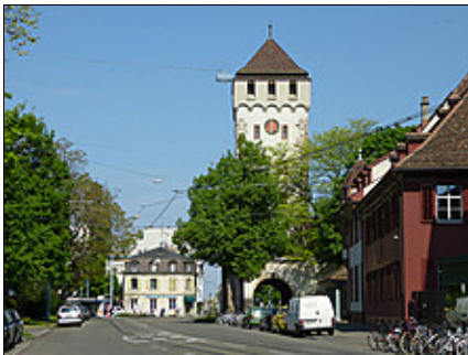
St. Johanns Tor Basel